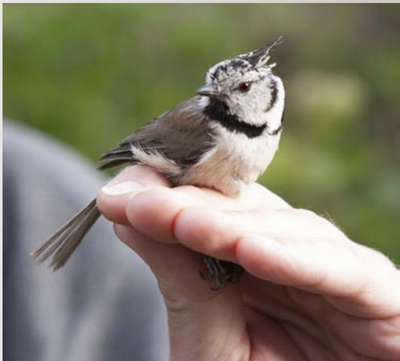
Topmeise, nu med ring. I den tid, hvor nettene er åbne, tjekkes hver halve time.