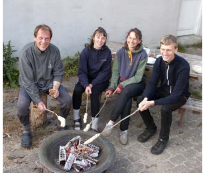
Madlavningstjansen går på skift, og på en god dag kan aftenen byde på snobrød og pølser på grillen.

andre arktiske vadefugle på en baggrund af en knaldblå himmel, i vindstille vejr og med en temperatur på op til 20 grader," fortæller han. "Nogle gange sidder vi på stranden i op til 12 timer, fordi trækket bare bliver ved og ved, og sådan en dag er livet dejligt."