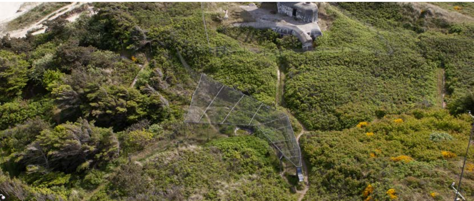
Blåvandsrusen er den eneste af sin art i Danmark. Den er bygget efter en model, man bruger på Helgoland og har en stor åbning, der leder fuglene ind i den ene ende og videre til et smalt bur, der ender i en kasse, hvor fuglene er nemme at tage med hånden. Fordelen er, at den er lidt mindre arbejdskrævende og at fuglene slipper for en tur i nettet. Bunkeren i baggrunden er en lyttepost fra 2. Verdenskrig.

"Et ophold som frivillig begynder typisk med, at man skriver eller ringer til stationen og fortæller lidt om, hvad man kan tilbyde, og hvad man ønsker at få ud af sit ophold. Hvis det ikke drejer sig om et længere ophold, kan man også spørge om lov til at bare møde op og hænge ud. Så vil man hurtigt blive en del af fællesskabet," fortæller han. "Som ny fugletæller vil du blive sidemandsoplært i kendetegn og alders-